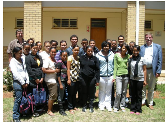
Springplank naar studie: a.s. studenten in een overbruggingsjaar (EUR 450 per student!)