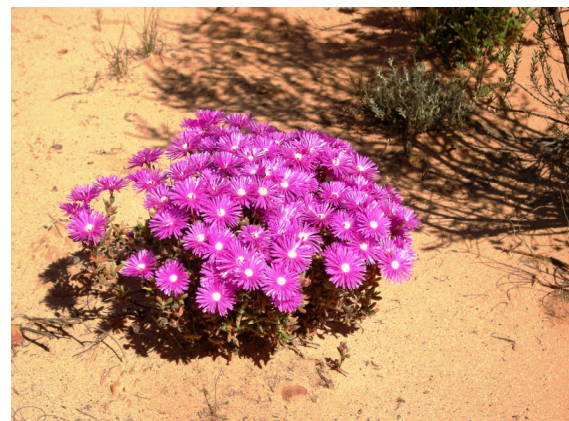
Die schoonheid van die Afrikaanse natuur!